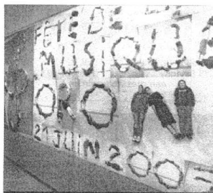
Nos corps ont composé les lettres de la fête.