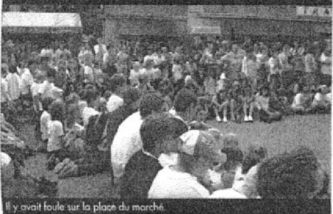
Il y avait foule sur la place du marché.