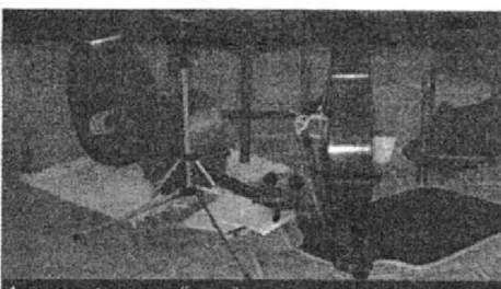
Apparemment une pause s'imposait.